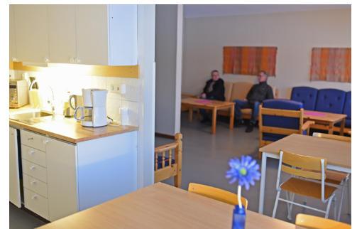
Mindre pentrykök och samlingsal i boendedelen.