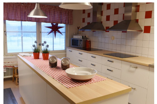
Tillagnings- och serveringskök.