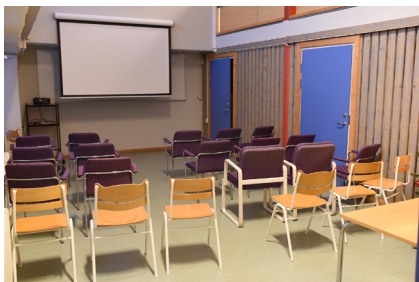
Samling / föreläsning.

Samlingsrum med soffor och bord. Konferensdel för cirka 25-30 personer med duk för projektor och internetanslutning.