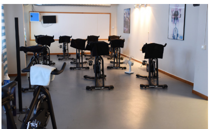
Spinningsal, tio cyklar.