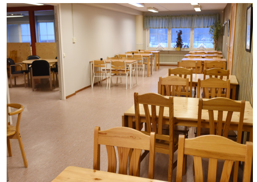
Del av matsalen.