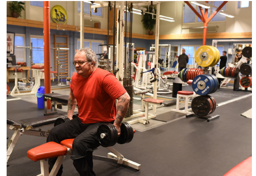
Gym i anslutning till boendet.