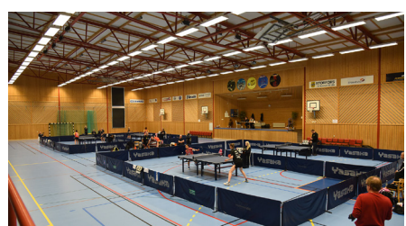
SM-slutspel i Pingisligan spelas här.