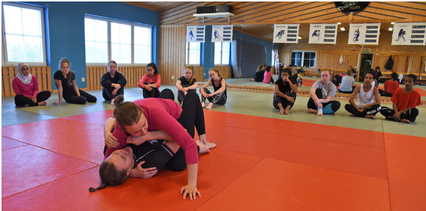
Judolokalen kan användas för träning eller boende på "hårt underlag".