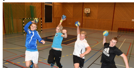
Handbollsklubben har träning för barn.