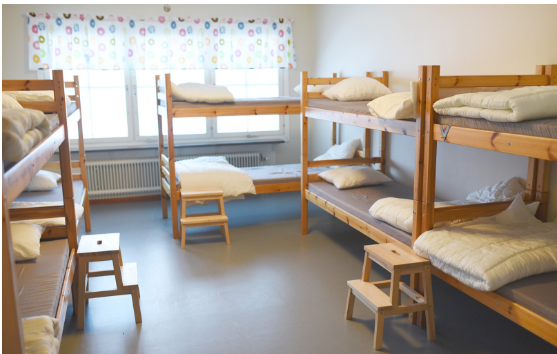
En av de största sovsalarna.

Skiss över boende och matsal. Ytterligare ett rum, ett tvåbäddrum, finns på våning- en under vandrarhemsvåningen (intill matsalen). Konferenssal ligger en trappa ner från matsalen. Judohall, gym och spinningrum ligger en trappa upp från boendedelen.